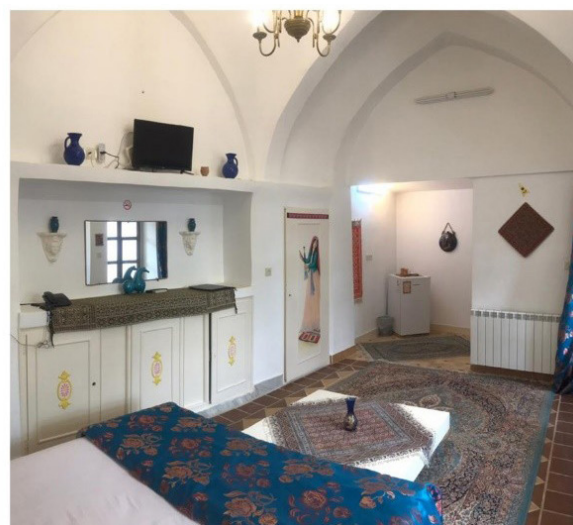
تصویر ۱. زوایای مختلف یکی از فضاهای اقامتی هتل سنتی نگین.

پتو می‌پوشاندند تا هوای زیر آن گرم بماند. افراد خانواده دور کرسی می‌نشسته‌اند و پاهای خود را برای گرم شدن زیر کرسی می‌گذاشته‌اند. همهٔ خانه‌ها در زمستان، حداقل در یک کرسی می‌گذاشته‌اند. - درست کردن لواشک و میوهٔ خشک، خواب شب تابستان و در هنگام عروسی‌ها، نگاه کردن از بالا به حیاط و کوچه در مسیر جهازبرون از فعالیت‌هایی است که در پشت‌بام حادث می‌شده است.